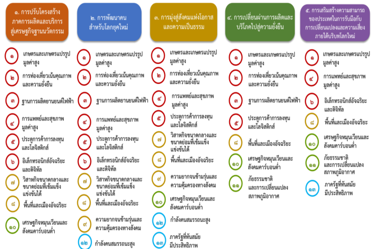
แผนภาพที่ ๓.๑ ความเชื่อมโยงระหว่างหมวดหมู่การพัฒนา กับเป้าหมายหลัก

ความเชื่อมโยงระหว่างหมวดหมู่การพัฒนา กับเป้าหมายหลักแสดงไว้ในแผนภาพที่ ๓.๑ โดยหมวดหมู่ การพัฒนาที่กำหนดขึ้นเป็นประเด็นที่มีลักษณะเชิงบูรณาการที่ครอบคลุมการพัฒนาตั้งแต่ในระดับต้นน้ำจนถึง ปลายน้ำ และสามารถนำไปสู่ผลพัฒนาทั้งในมิติเศรษฐกิจ สังคม ทรัพยากรธรรมชาติและสิ่งแวดล้อมไปพร้อมๆ กัน ทำให้หมวดหมู่แต่ละประการสามารถสนับสนุนเป้าหมายหลักได้มากกว่าหนึ่งข้อ นอกจากนี้การพัฒนาภายใต้ แต่ละหมวดหมู่ไม่ได้แยกขาดจากกัน แต่มีการสนับสนุนหรือเอื้อประโยชน์ซึ่งกันและกัน